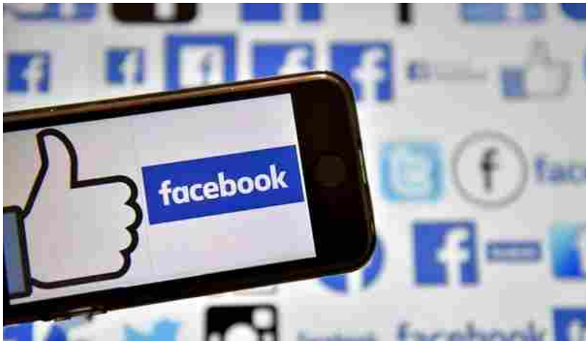
Social network